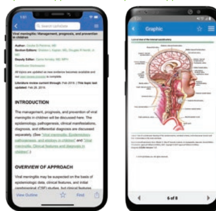
UpToDate App for Android®

Nota bene: in-applicazione e messaggi di posta elettronica vi informeranno della necessità di verificare l'affiliazione se non lo avete fatto entro il giorno 80. Riceverai un secondo avviso al giorno 90. Se non verifichi nuovamente entro il giorno 90, perderai l'accesso mobile e remoto. Per riconquistare l'accesso, completa il processo di ricontrollo descritto nei metodi 1 o 2 sopra descritti.